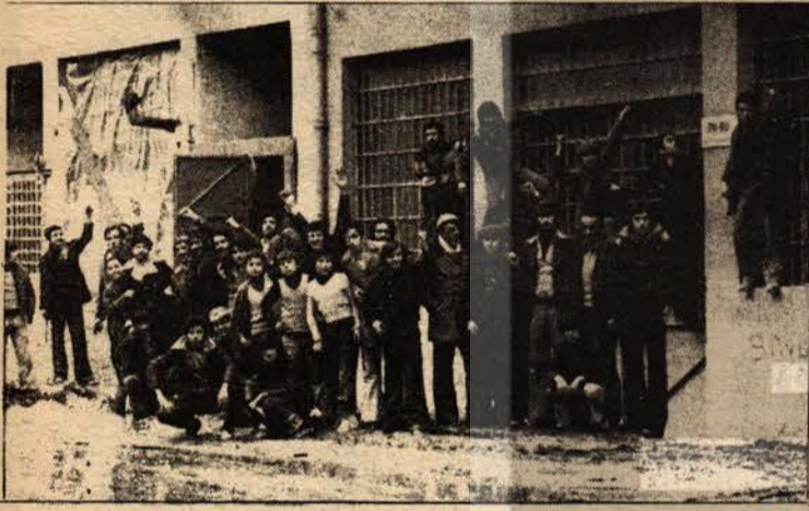
De-Ko işçileri: Sendikamızı mutlaka kabul ettireceğiz.

Ben de şunu söylemek istiyorum: Bizim ülkemizi Amerika sömürüyordu. Ama Rusya yavaş yavaş onu geçiyor. Kancayı önce İskenderun'da taktı, sonra elektrik meselesine. Son anlaşmaya da hayır diyoruz. Çünkü Rusya bütün halkların en tehlikeli düşmanıdır. Biz bunlara karşı bilmadan usanmadan, sonuna kadar mücadele etmeye kararlıyız.