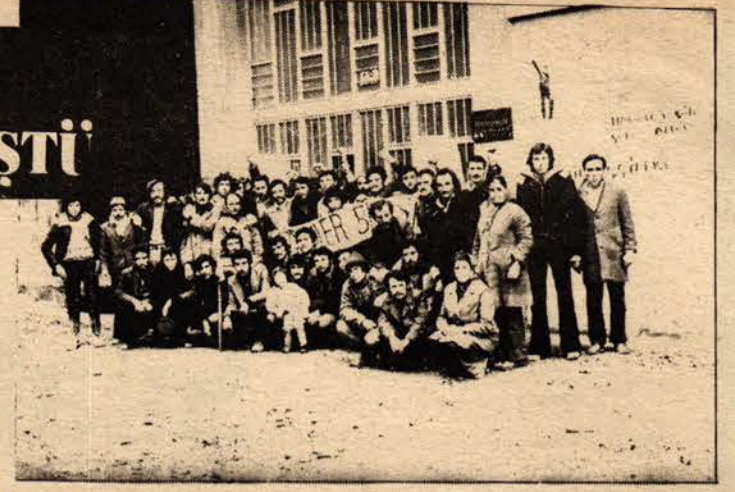
Direnışteki NORAMİN işçileri : İş güvenliğini istiyoruz!

Istanbul Sanayi Mahallesi deki De-Ko Kilit Fabrikası işçileri bir haftadır direniyorlar. Fabrikada çalışan 52 işçileri Maden-İş Sendikasında örgütlenince hapsi birden işten adılmışlar. De-Ko fabrikasında en ağır sömürü şartları hüküm sürmekte ve işçiler hiç bir sosyal haktan yararlanmamaktadırlar.