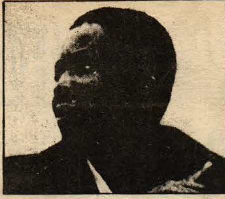
ZANU önderi Robert MUGABE

Delikanlılarımız ve genç kızlarımız beyaz baskıcı ve sömürücülerin yerini siyah baskıcı ve sömürücüler alsın diye mücadele vermiyorlar. Onlar, halkın özgür Zimbabvesi için mücadele ediyorlar.